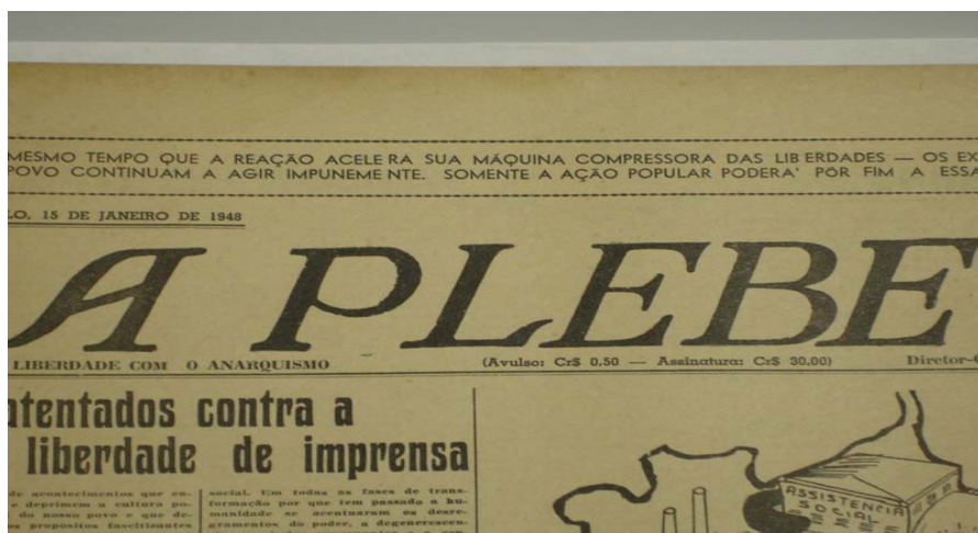
A Plebe . São Paulo/SP; Ano 31, nº12, Janeiro 1948, pág.01