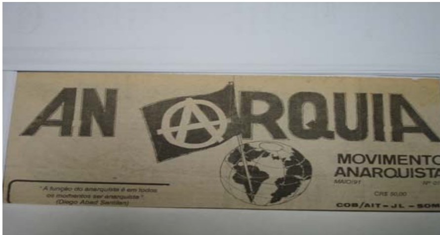
Anarquia . nº01, Maio 1991, pág. 01